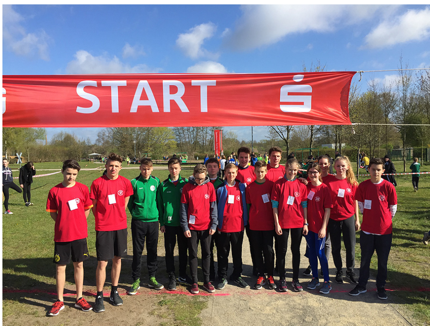
Die erfolgreiche Mannschaft der RHG.